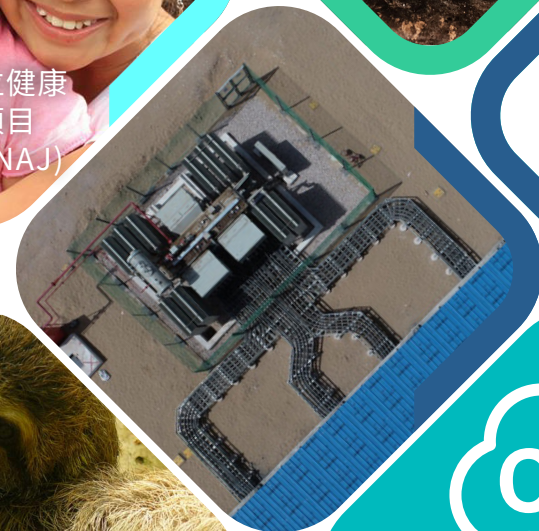
印度 拉賈斯坦邦 400 MW 太陽能 發電項目