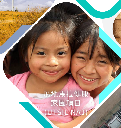
瓜地馬拉健康 家園項目 (UTSIL NAJ)