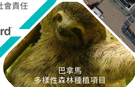
巴拿馬 多樣性森林種植項目