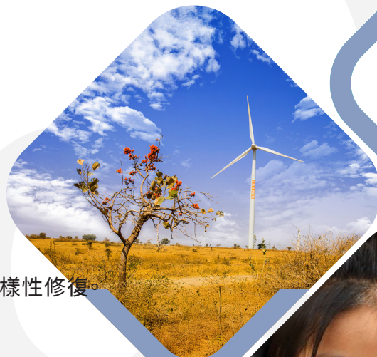
印度中央邦 50 MW 風力發電項目