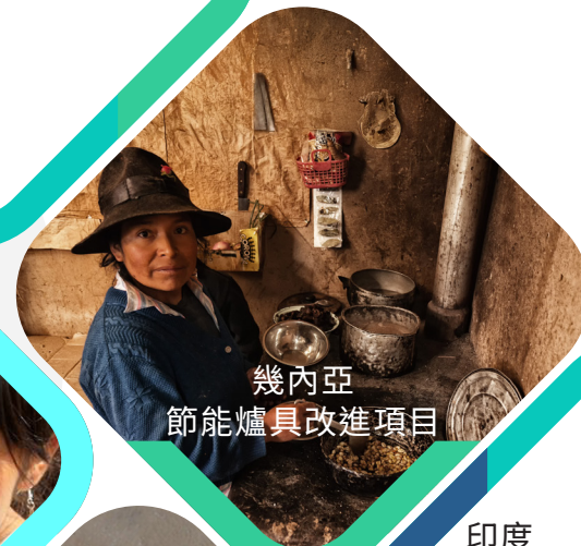
幾內亞 節能爐具改進項目