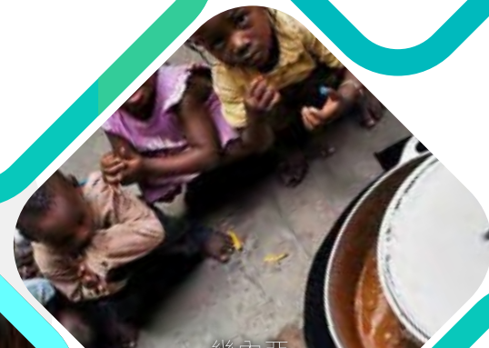
幾內亞 改進爐灶項目