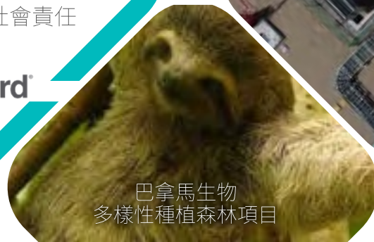
巴拿馬生物 多樣性種植森林項目