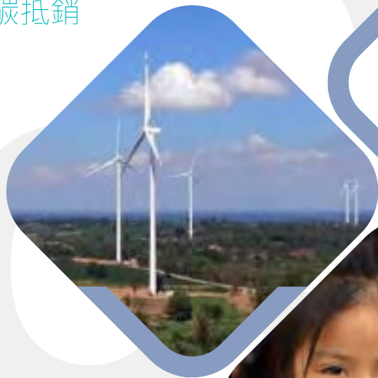
泰國 猜也蓬風電 項目