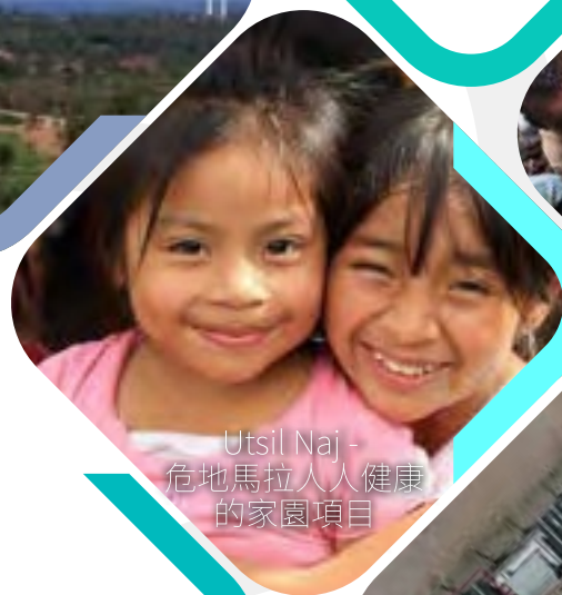
Utsil Naj - 危地馬拉人人健康 的家園項目